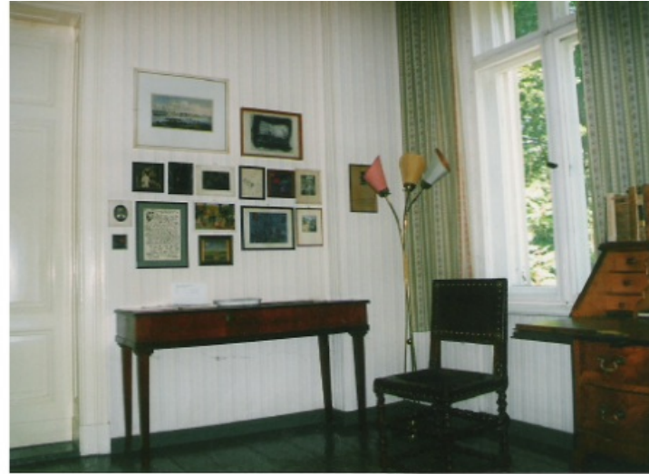
Bobrowskis Arbeitszimmer in Berlin-Friedrichshagen